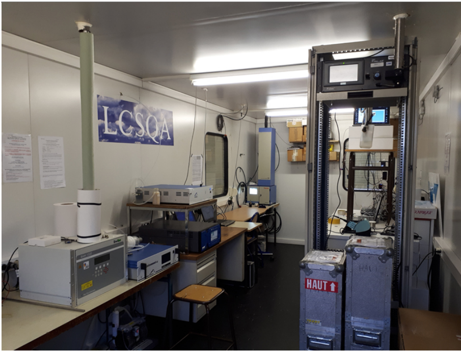
IMT Lille Douai

En savoir plus : laurent.spinelle@ineris.fr et nathalie.redon@imt-lille-douai.fr