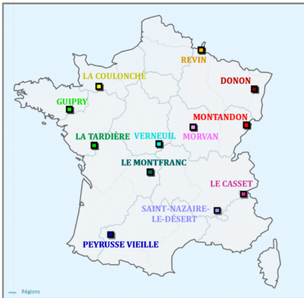
Localisation géographique des stations MERA en 2019